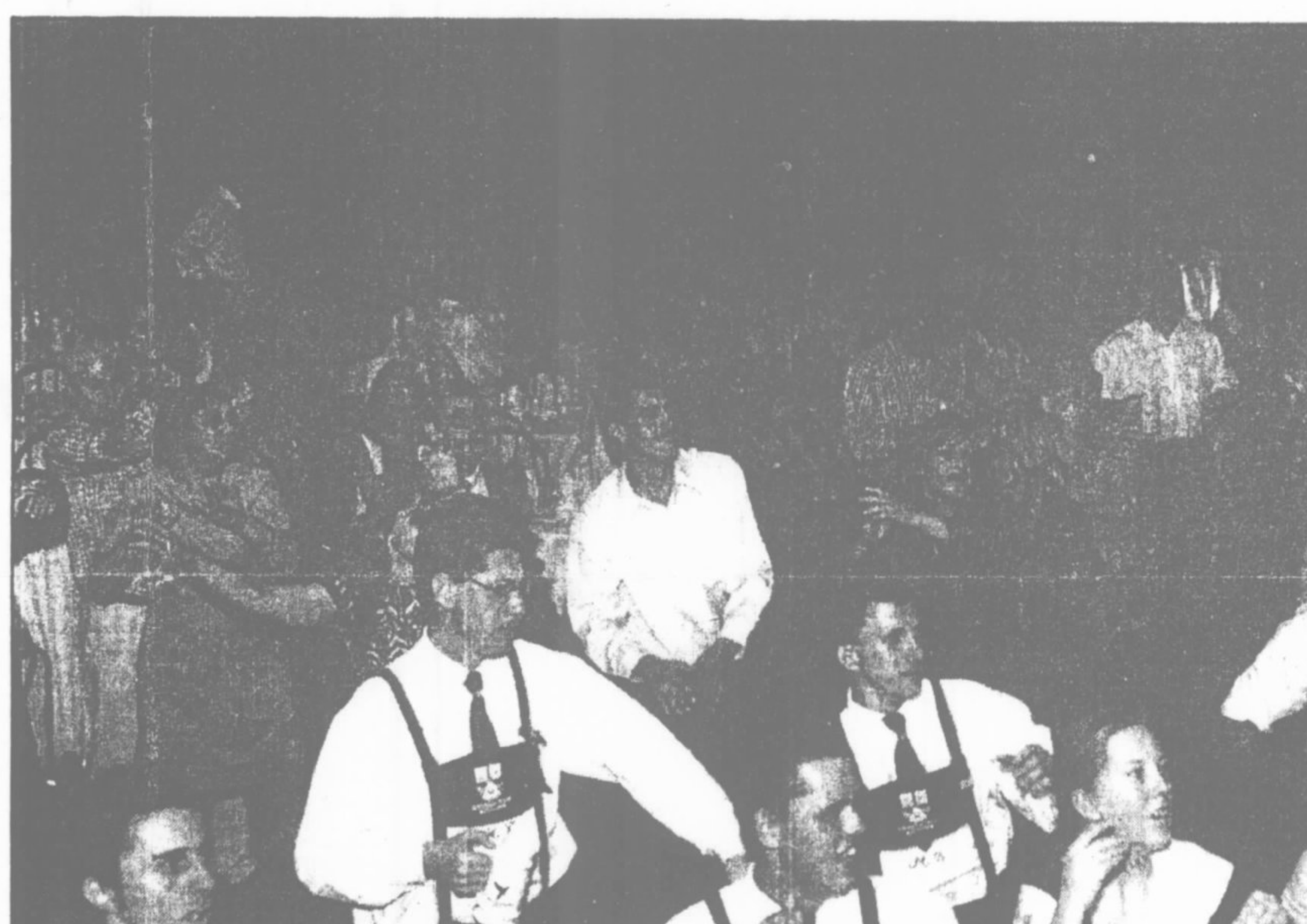
O Grupo Folclórico da Ocktoberfest na dança Junto com os Corretores