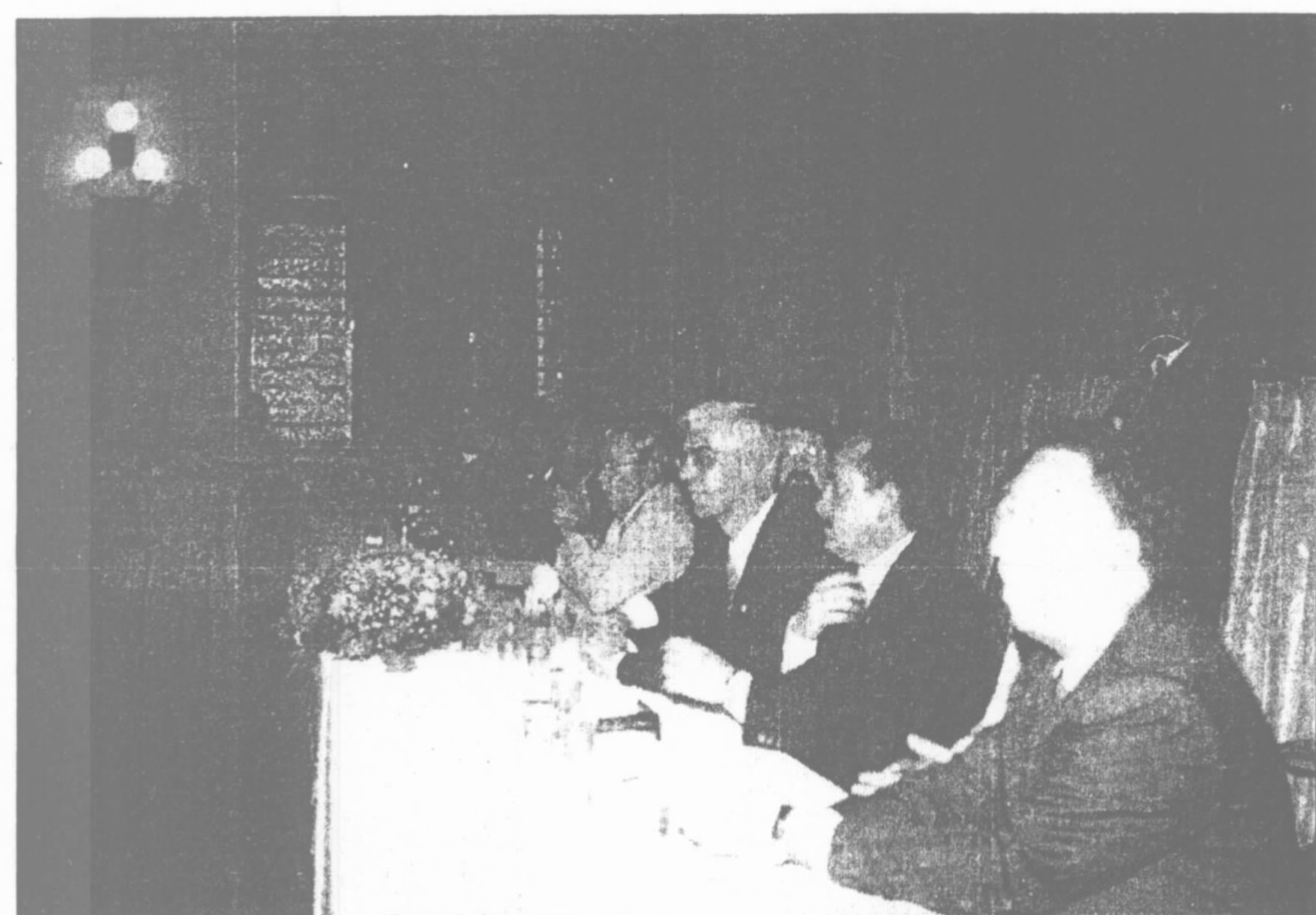
Composição da mesa por autoridades Classistas